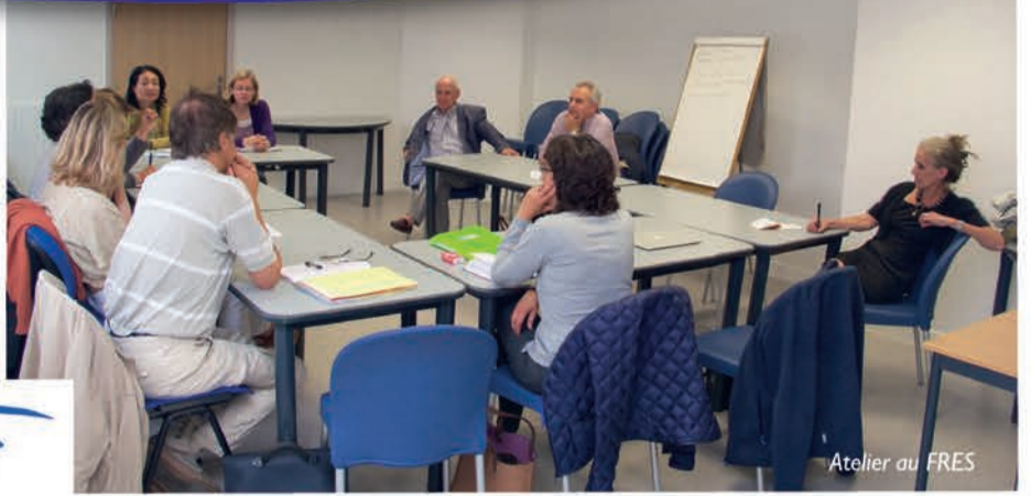
Atelier au FRES

Et tout le monde chante et travaille en vue des auditions. Cette année, les dates en sont un peu chamboulées - élections présidentielles obligent - mais nous ferons notre possible pour que tout se passe le mieux du monde... comme d'habitude !!!