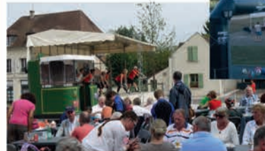
Forum des associations et démonstrations

Tournée des talents avec Réseau & Compétences