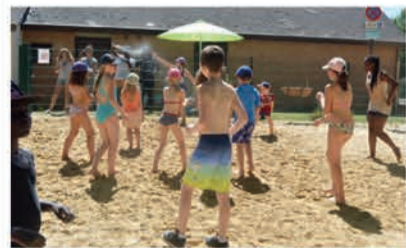
On dirait le sud...